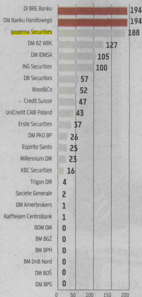
LICZBA PUNKTÓW PRZYZNANA POSZCZEGÓLNYM BIUROM*