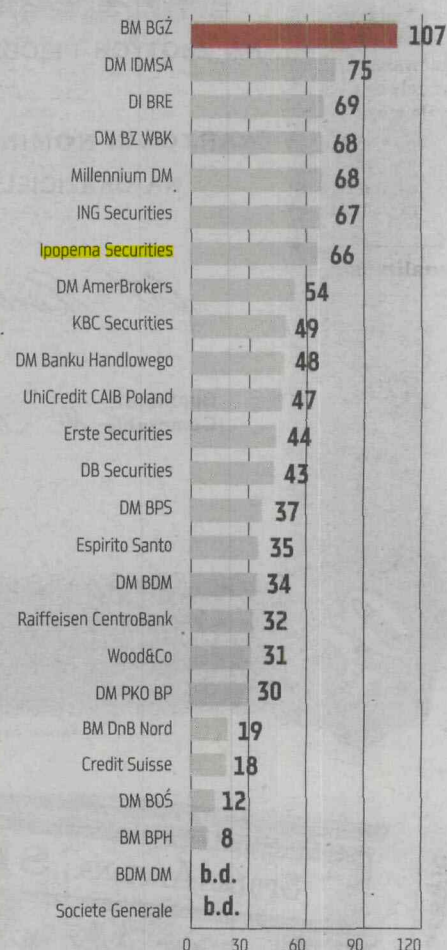
IŁE SPÓŁEK ANALIZUJĄ POSZCZEGÓLNE BIURA*